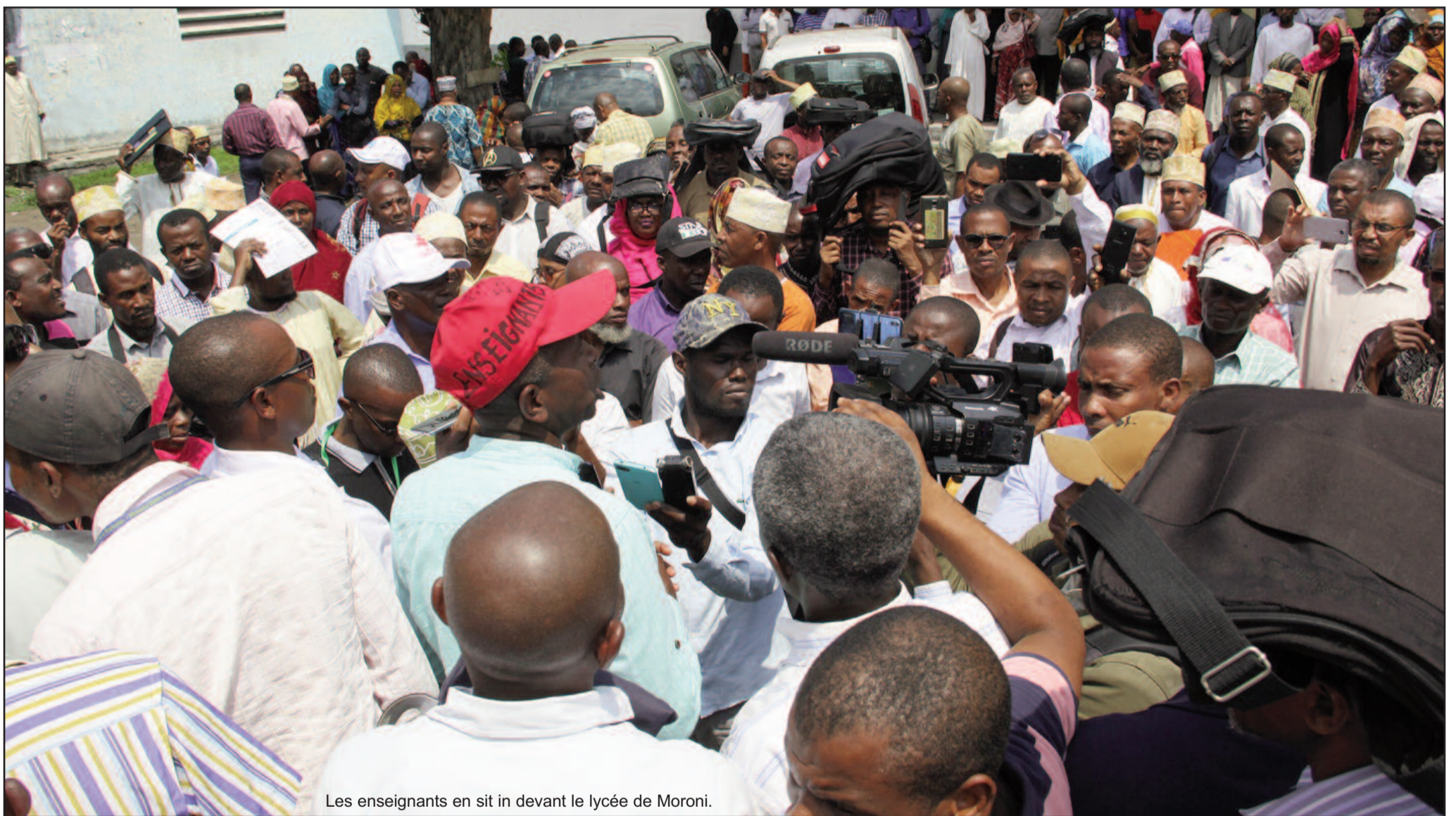
Les enseignants en sit in devant le lycée de Moroni.